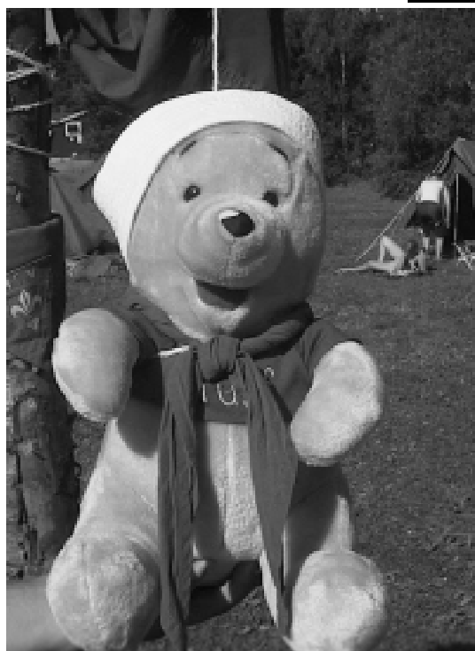
Kökarsörenin suloinen maskotti - hirressä...