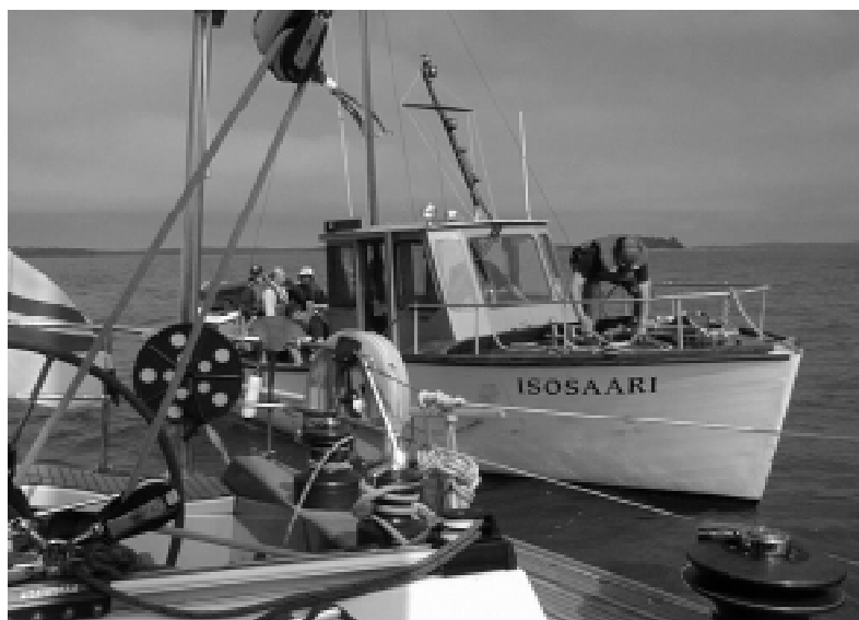
Ex-pelastusristeilijä Isosaari ohittaa Tokka-Lotan.