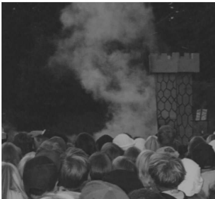
Päättäjäisissä ammuttiin murskaks se fästinki.